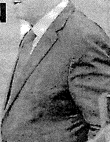
BENET UŠAO U POLITIKU KAO ŠEF KABINETA NETANJAHUA